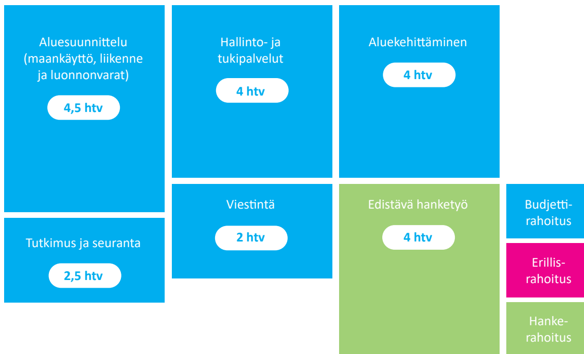
Kuva 2. Päijät-Hämeen liiton henkilöresurssi vuoden 2019 tilanteessa

Kaikkien liiton työntekijöiden toimenkuvat on tarkistettu vuoden 2019 aikana.