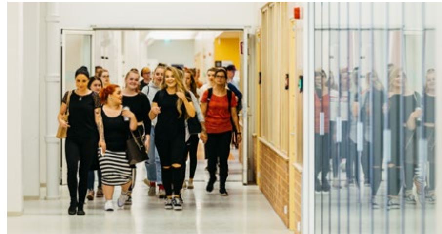
Lahti Campus